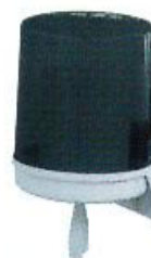
Despachador para Toalla Fluido Céntrico

Dimensiones: 37 x 30.5 x 26 cm Clave: DE08560