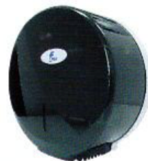
Despachador para Papel Higiénico Master King Jumbo

Dimensiones: 27.5 x 27 x 12.7 cm Clave: DE08506