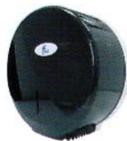
Despachador para Papel Higiénico Master Junior

Buscando brindar un servicio más completo, contamos con una Línea de Despachadores ideales para todos los productos de línea institucional. (Medidas: Alto x Ancho x Profundidad).