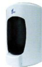
Despachador para Jabón líquido

Dimensiones: 35 x 23 x 26 cm Clave: DE08508