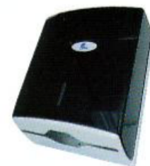
Despachador para Toalla interdoblada

Dimensiones: 27 x 27 x 19 cm Clave: DE08520