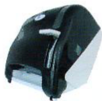
Despachador para Toalla en Rollo

Dimensiones: 34.5 x 27 x 13.5 cm Clave: DE08514