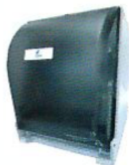
Despachador para Toalla en Rollo freehand

Dimensiones: 37 x 30.5 x 26 cm Clave: DE08510