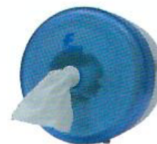
Despachador para Papel Higiénico Pre-Cut

Dimensiones: 35 x 34 x 13.5 cm Clave: DE08504