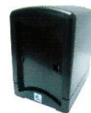
Despachador para Servilleta c/12

Dimensiones: 21 x 13 x 9.5 cm Capacidad: 900 ml Clave: DE08566